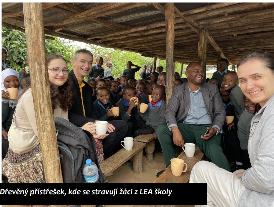
Dřevěný přístřešek, kde se stravují žáci z LEA školy