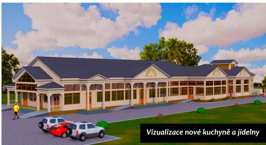
Vizualizace nové kuchyně a jídelny