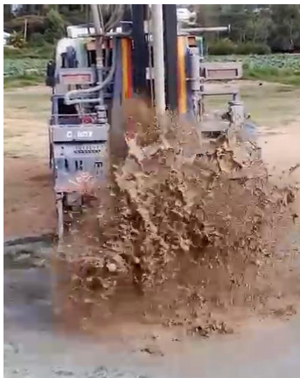
Hlubinný vrt v areálu školy LEA

V Dongobeshi se dlouhodobě potýkáme s nedostatkem dobré vody. Loňský rok byl zvláště suchý a za dodávky vody jsme pak platili velmi vysoké částky. Naši němečtí přátelé zafinancovali hlubinný vrt a vznik studny.